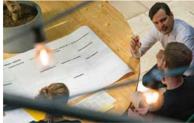
Zusammenarbeit über Sektorgrenzen hinweg hilft Social Start-ups und Wohlfahrtsverbänden.

Klassische Verbandsorganisationen haben ihre Stärke in der Standardisierung, in der Aufgabenteilung und in der Spezialisierung. Eine neue Kultur des Sozialunternehmertums bedeutet, das bekannte Terrain zu verlassen. Es gilt, Neues, Unbekanntes auszuprobieren und zu erproben. Wer sich mit den ungedeckten Bedarfen von Klient*innen und Kostenträgern auseinandersetzt, kann daraus neue Geschäftsmodelle entwickeln. Dies erfordert Mut, Risikofreude und Veränderungsbereitschaft.