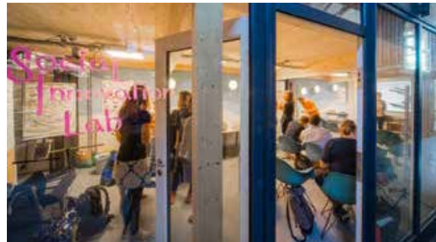
Das Social Innovation Lab in Freiburg