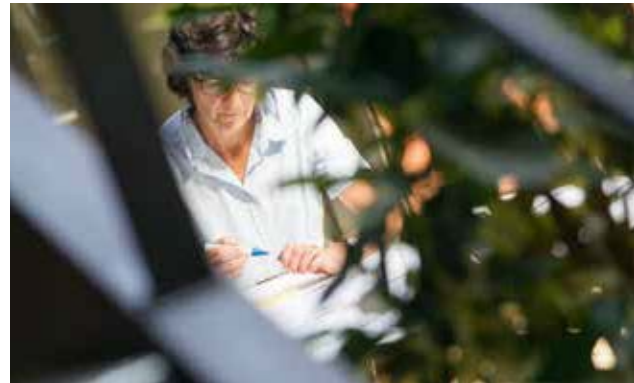
Die entstandenen Verbindungen bleiben auch über die gemeinsamen Programme hinaus bestehen.